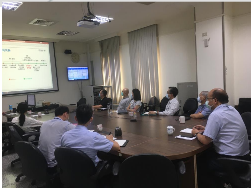
與會人員聽取簡報